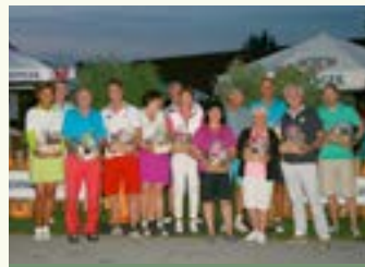
After Work Day