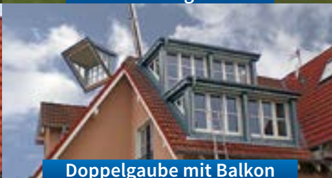
Doppelgaube mit Balkon