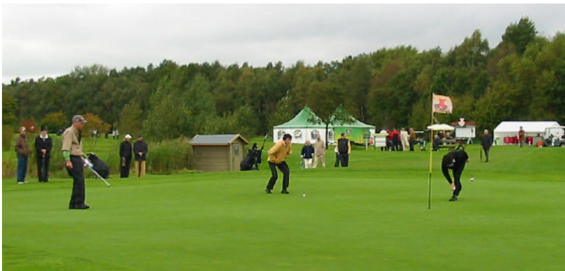
8. Einstelligen-Turnier 2007

Weitere Informationen unter: www.golfclub-am-meer.de