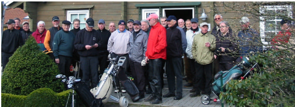
Auslosung der „Flights“ am 5. März 2008 vor dem Clubhaus am Meer

Für das HeMiGo gibt es in der neuen Saison eine neue Startregelung. Beginnend mit dem 2. April 2008 wird nunmehr regelmäßig um 12.00 Uhr gestartet – bisher um 11.00 Uhr. Dies ist eine Anpassung an die DiDaGo Regelung. Die vorgabewirksamen Turniere starten wie bisher um 14.00 Uhr.